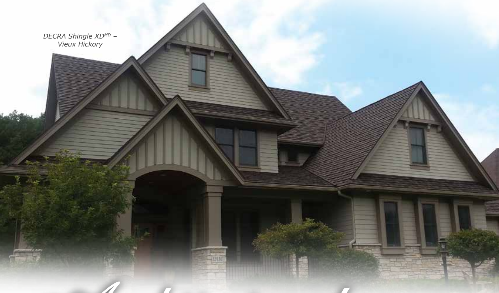
DECRA Shingle XD MD – Vieux Hickory

DECRA Shingle XD MD avec ses bords épais taillés ainsi que des traits d'ombre profonds et distincts, il fournit une plus ample dimensionnalité et une apparence robuste et il est idéal si vous préférez l'apparence de bardeaux architecturaux de forte passe.