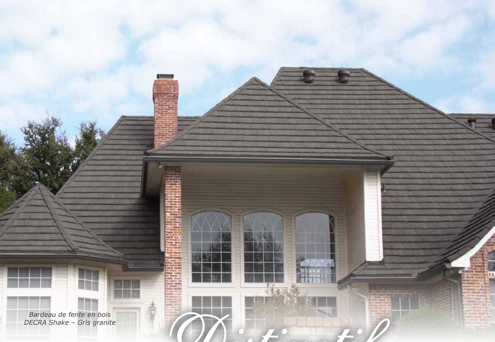
Bardeau de fente en bois DECRA Shake – Gris granite