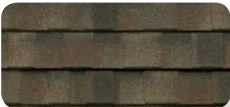
Pavé rond classique