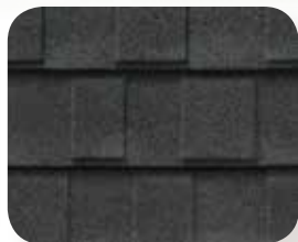
Éclipse de minuit