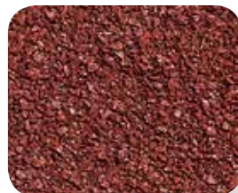
Grenat (Tuile seulement)