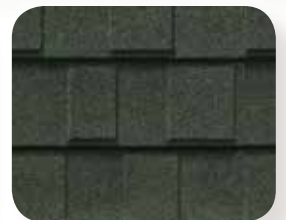
Vert de région boisée

Touches de couleurs : À cause du procédé d'impression, les couleurs peuvent différer du produit actuel. Veuillez vous reporter à un exemplaire du produit actuel d'un panneau avant de passer une commande.