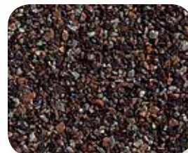
Bois d'oeuvre altéré par le temps