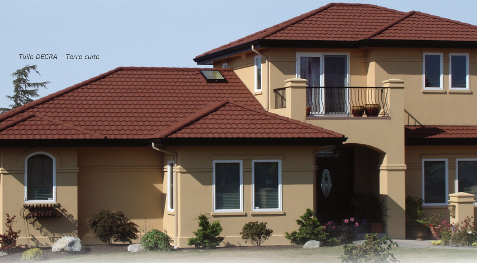
Tuile DECRA - Terre cuite