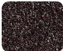
Bois des ombres