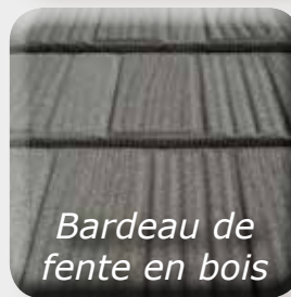
Bardeau de fente en bois