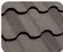
Cendres de Pompéi