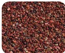
Terre cuite, (tuile seulement)